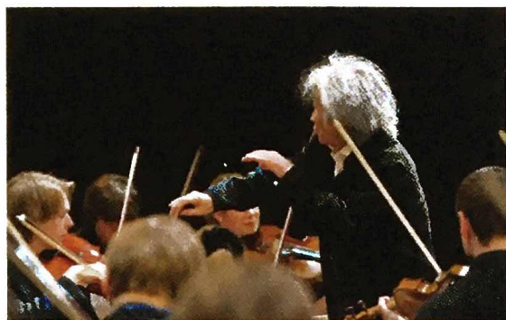
Seiji Ozawa

Passionné par l'enseignement, Seiji Ozawa a fondé en 2004 à Rolle près de Genève l'International Music Academy – Switzerland, connue depuis 2011 sous le nom de 'Seiji Ozawa International Academy Switzerland'.