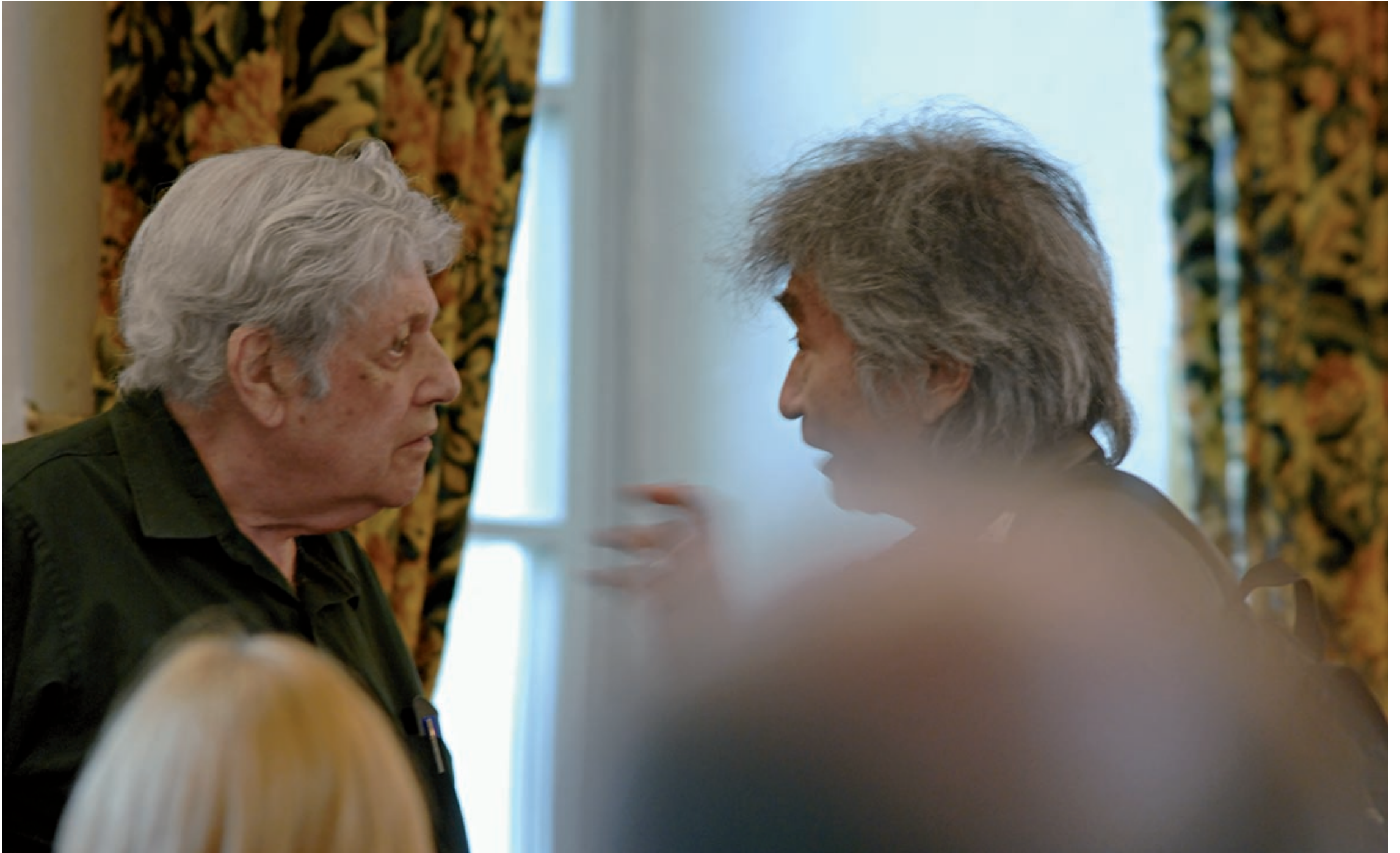
Robert Mann, Seiji Ozawa