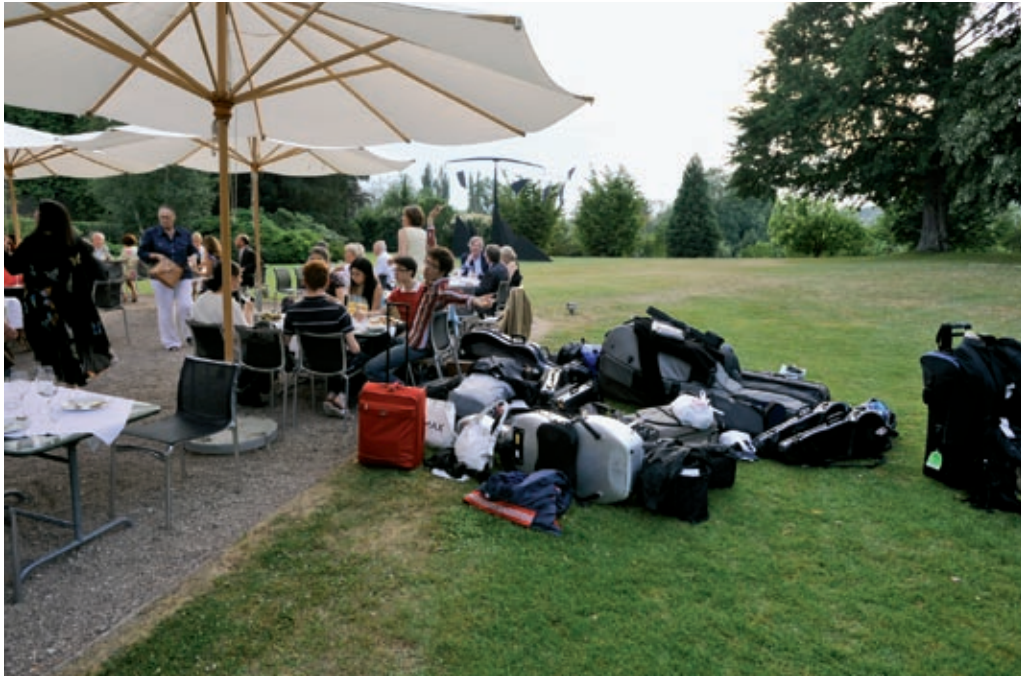
FONDATION BEYELER, BÂLE